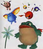
ステージ1ボス 「ゲボゲボ」