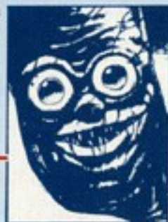
こうほめいしや ◀ 光霸明宗