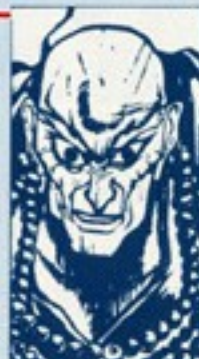
きゆうら ▲ 凶羅