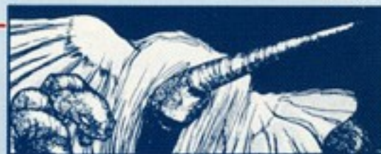
ひとつき ▼ 一鬼