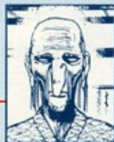
とおのようかい おさ ◀ 遠野妖怪の長